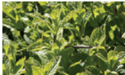
Il existe plusieurs centaines de menthes différentes qui grandissent très facilement.