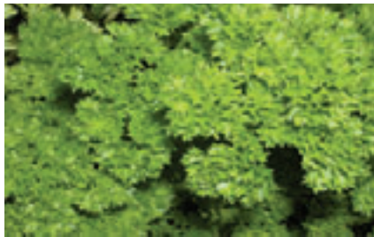
Incontournable, le persil frisé est la plante aromatique de cuisine idéale.