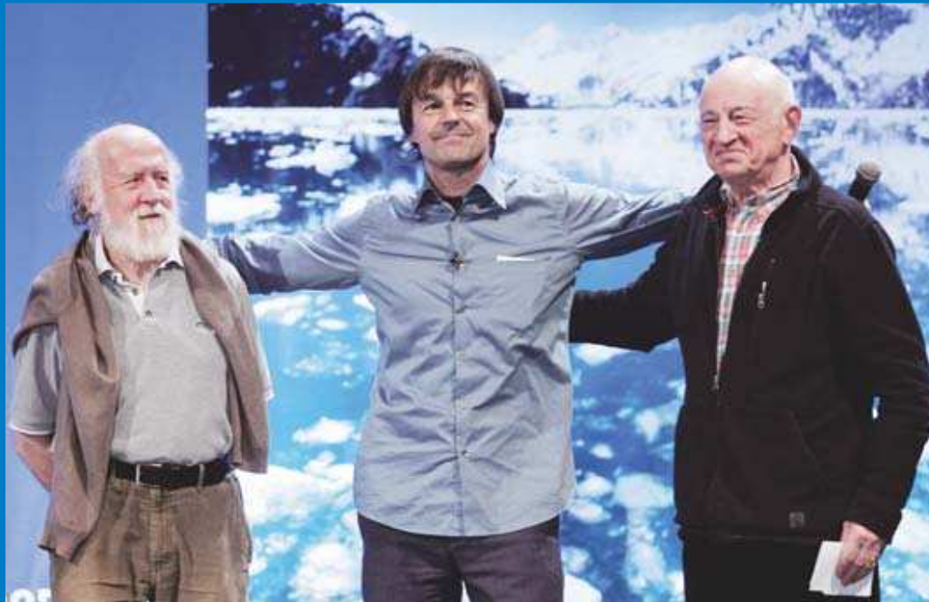
Aux côtés de Nicolas Hulot et du philosophe et sociologue Edgar Morin, à Paris, le 1 er avril 2007, lors d'une conférence sur le pacte écologiste proposé par le journaliste français.

“ Il ne peut y avoir d'avenir décent pour l'humanité qu'avec l'économie, le social et l'environnement traités à part égale. ”